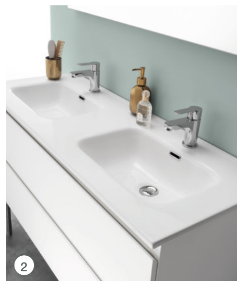
Plan céramique double vasque L120 cm