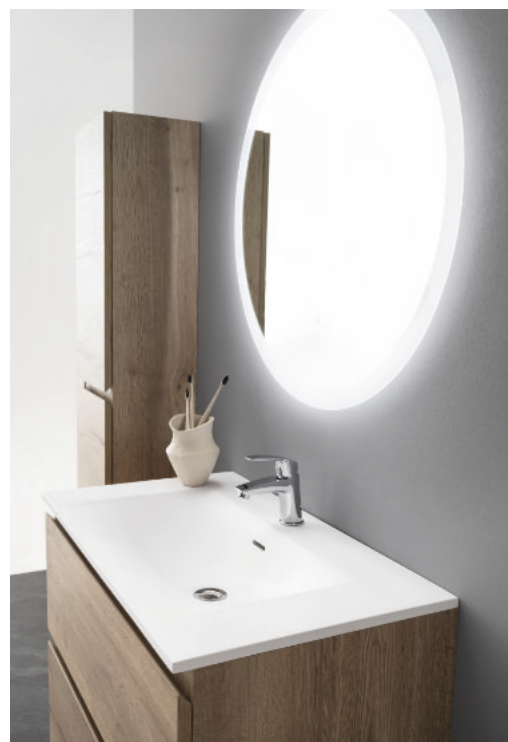
Meuble L 80 cm mélaminé chêne foncé - Plan vasque Mineral Solid - Miroir rond rétroéclairé