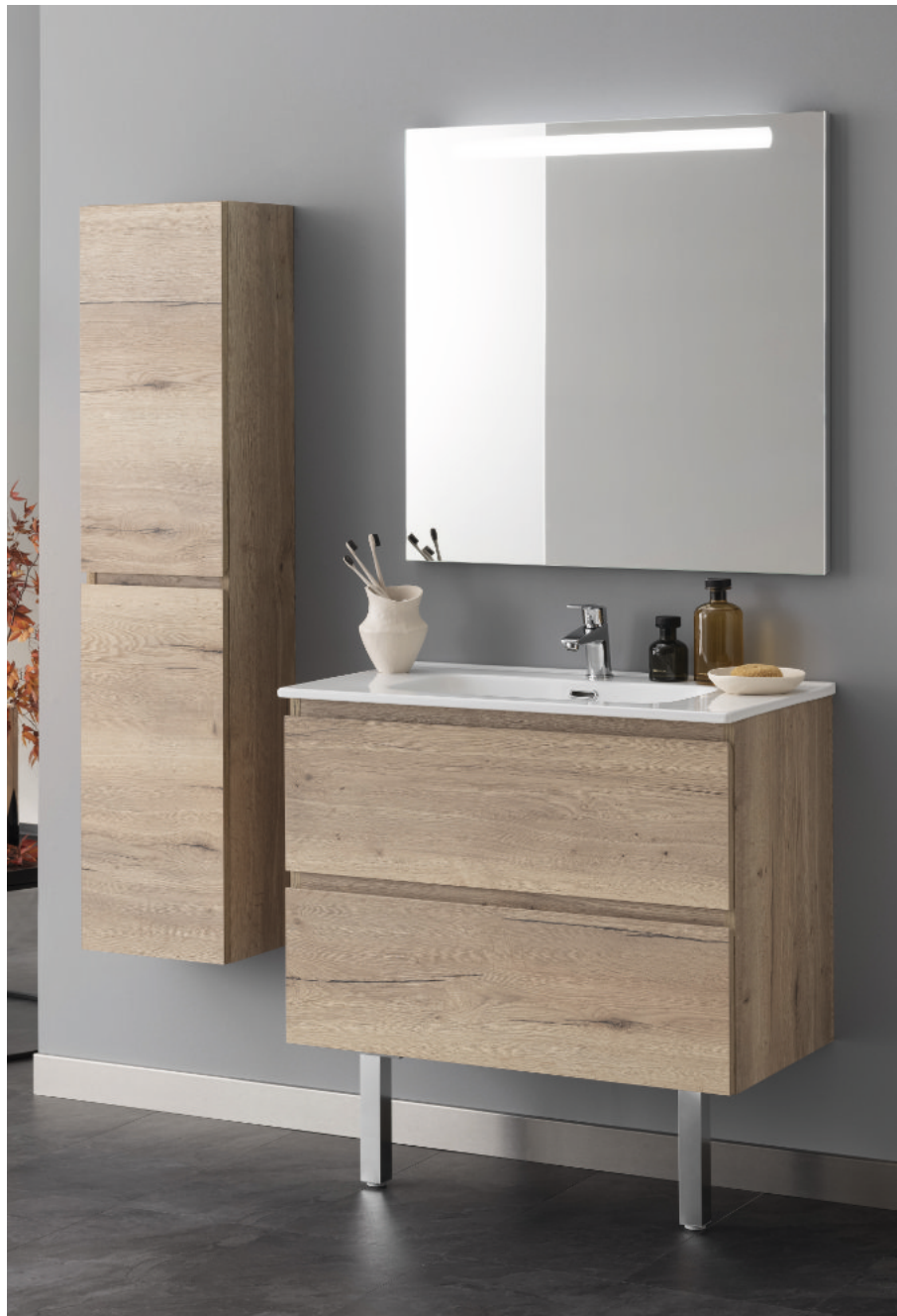
Meuble L 80 cm mélaminé chêne brut – Miroir rétroéclairé H 80 cm