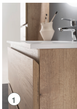
Prise de main sur les façades meubles et colonnes