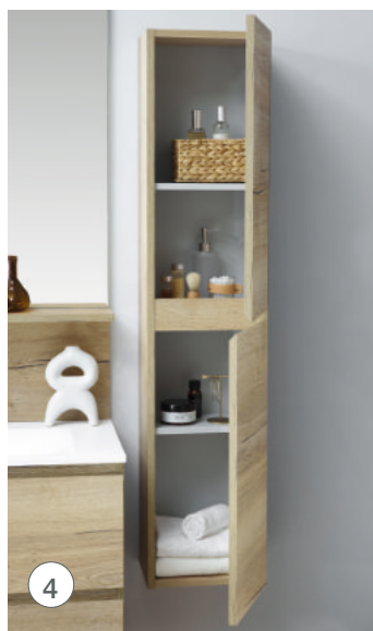
Colonne mélaminé chêne brut