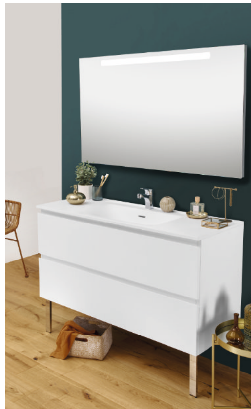
Meuble L 120 cm sur pieds laqué blanc mat - Miroir rétroéclairé H 80 cm