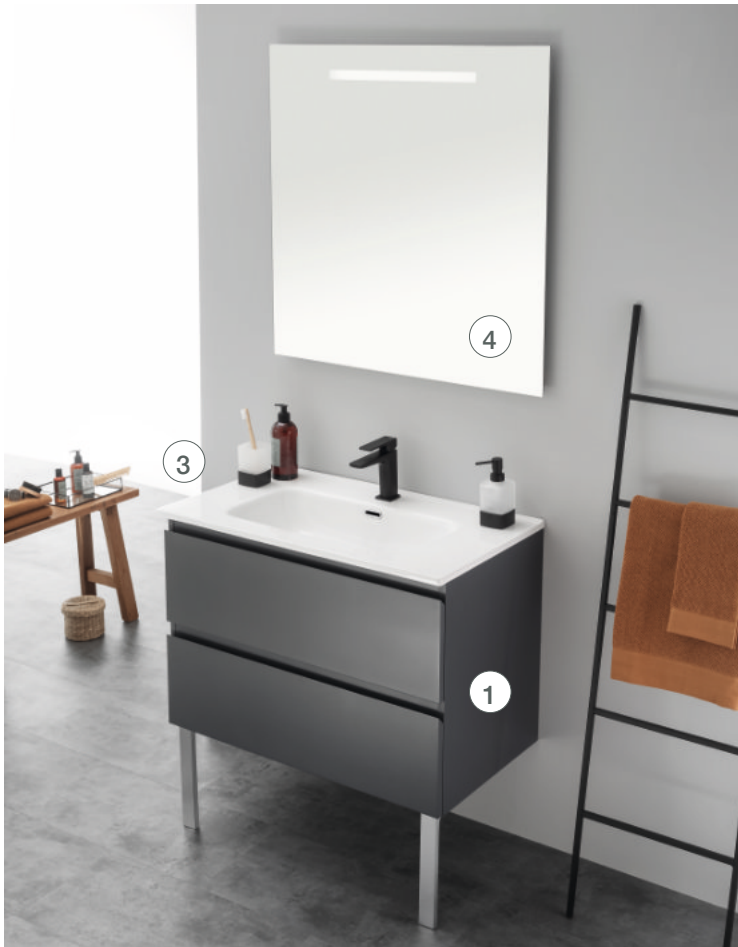
Meuble L 80 cm sur pieds - coloris laqué gris anthracite mat Miroir rétroéclairé H 80 cm