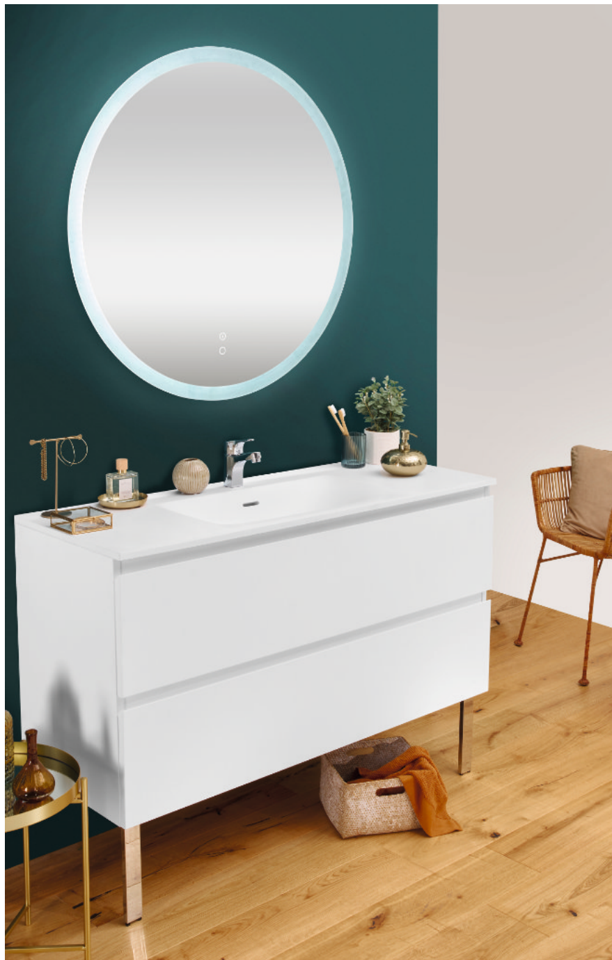
Meuble L120 cm coloris laqué blanc mat – Miroir rond Ø 90 cm rétroéclairé et antibuée