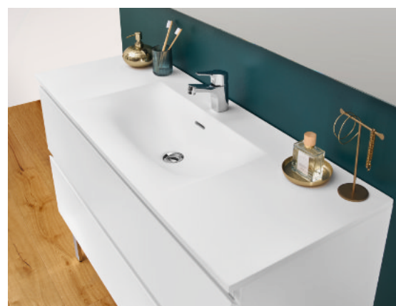
Plan vasque Mineral Solid L120 cm