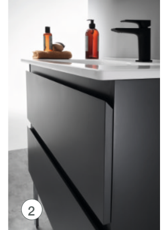
Prise de main sur le profil de la façade de tiroirs.