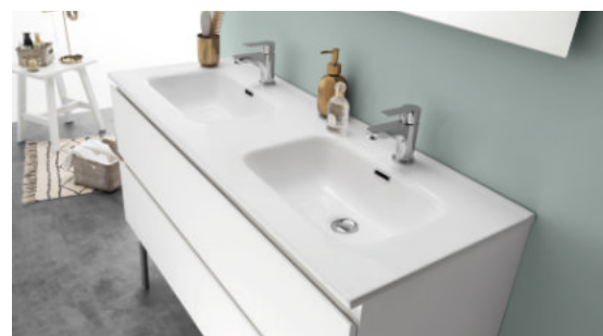
Plan céramique double vasque L 120 cm