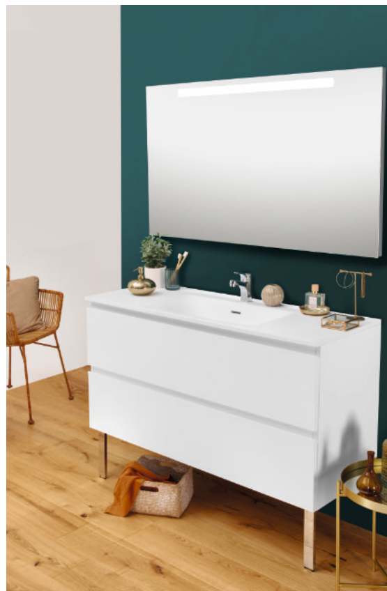
Meuble L120 cm sur pieds coloris laqué blanc mat Miroir rétroéclairé H 80 cm